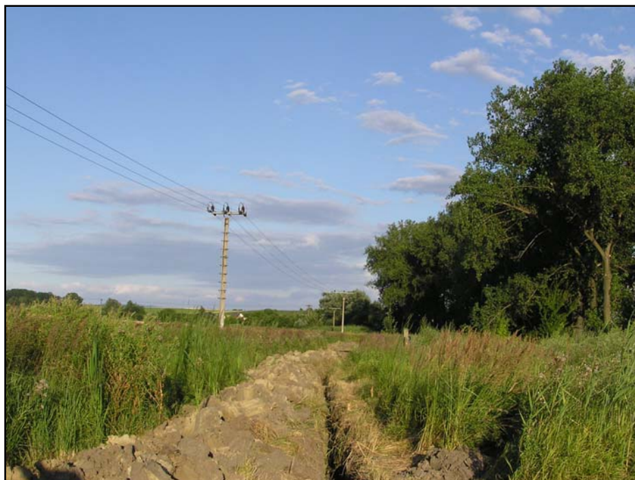
Tab. 2.2. Výkopová rýha při polní cestě propojující Jižní Čtvrť s Újezdcem.