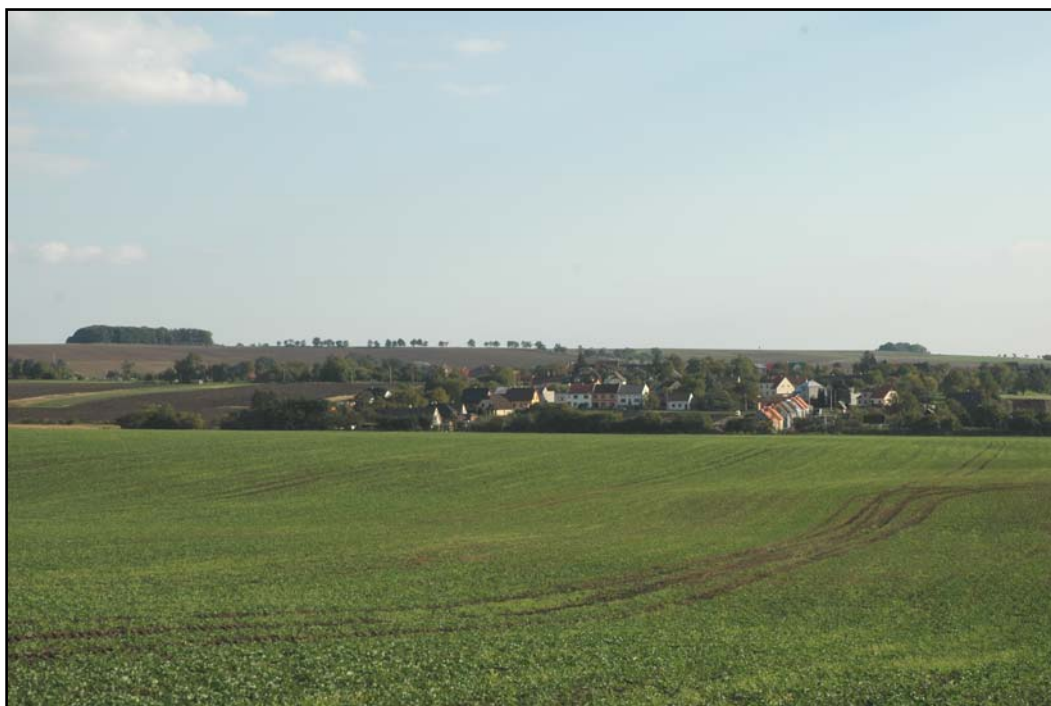
Tab.1.1. Celkový pohled na Újezdec od severu. V pozadí Švédské šance.