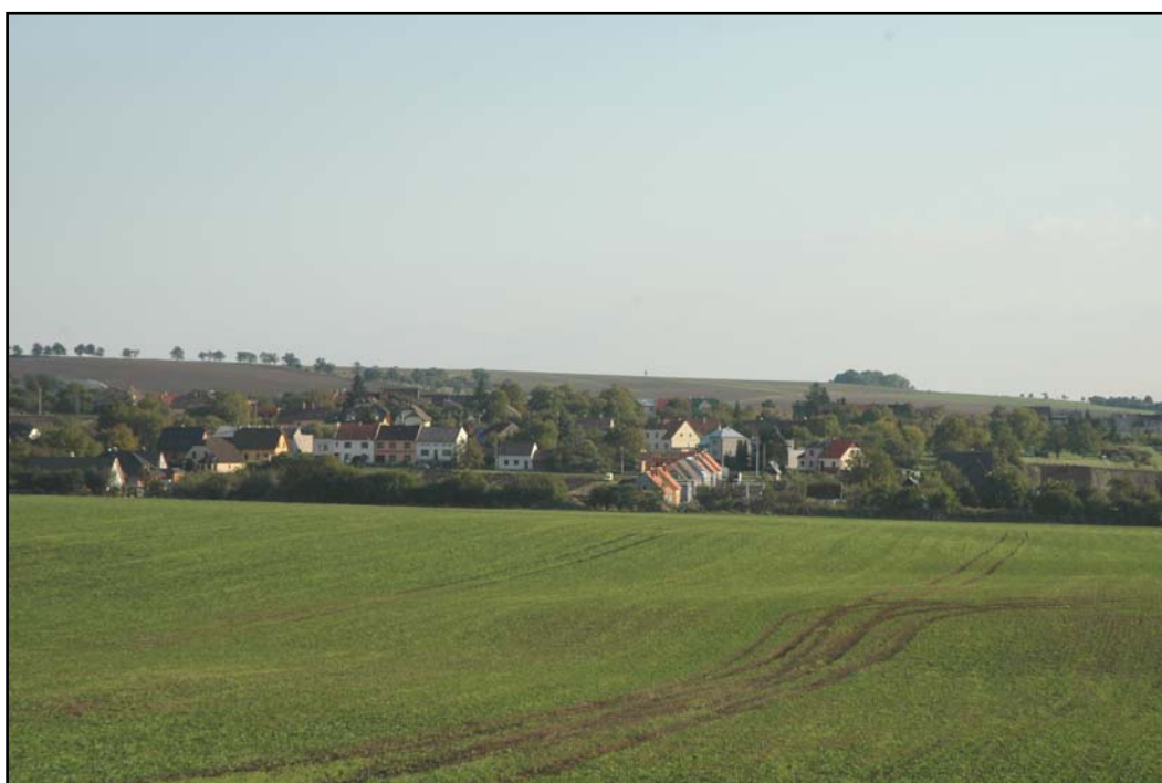
Tab. 1.2. Detailní pohled na severní část Újezdce.