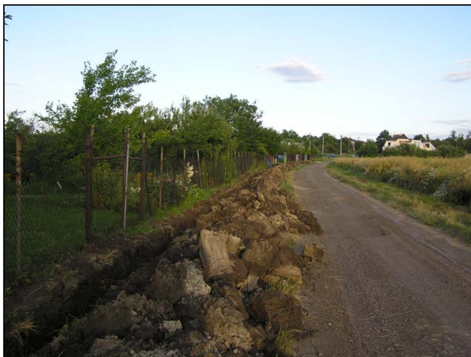
Tab. 2.1. Průběh trasy televizního kabelového rozvodu při zahrádkářské kolonii u Nové Čtvrtě na katastru Újezdce.