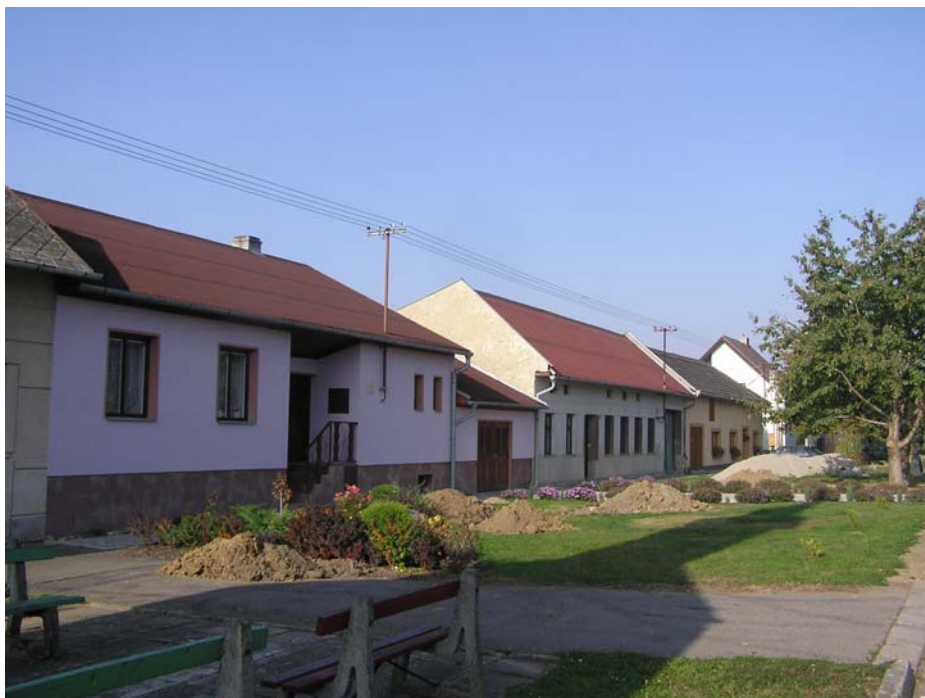
2.1 Výkopy podél západní uliční fronty v ulici Zakladatel.