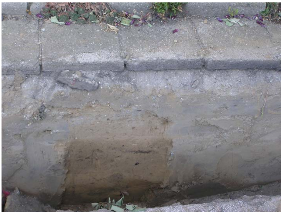
2.2 Situace před domem č.p. 17 / č.o. 8 v ulici Zakladatel.