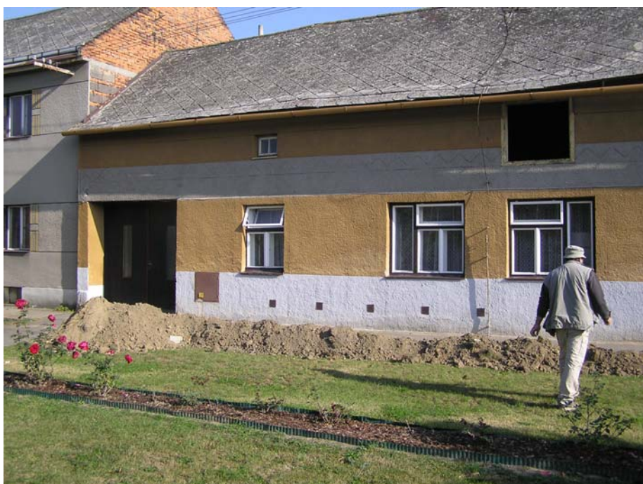
1.2 Archeologický dohled nad výkopovými pracemi podél východní strany ulice Zakladatel.