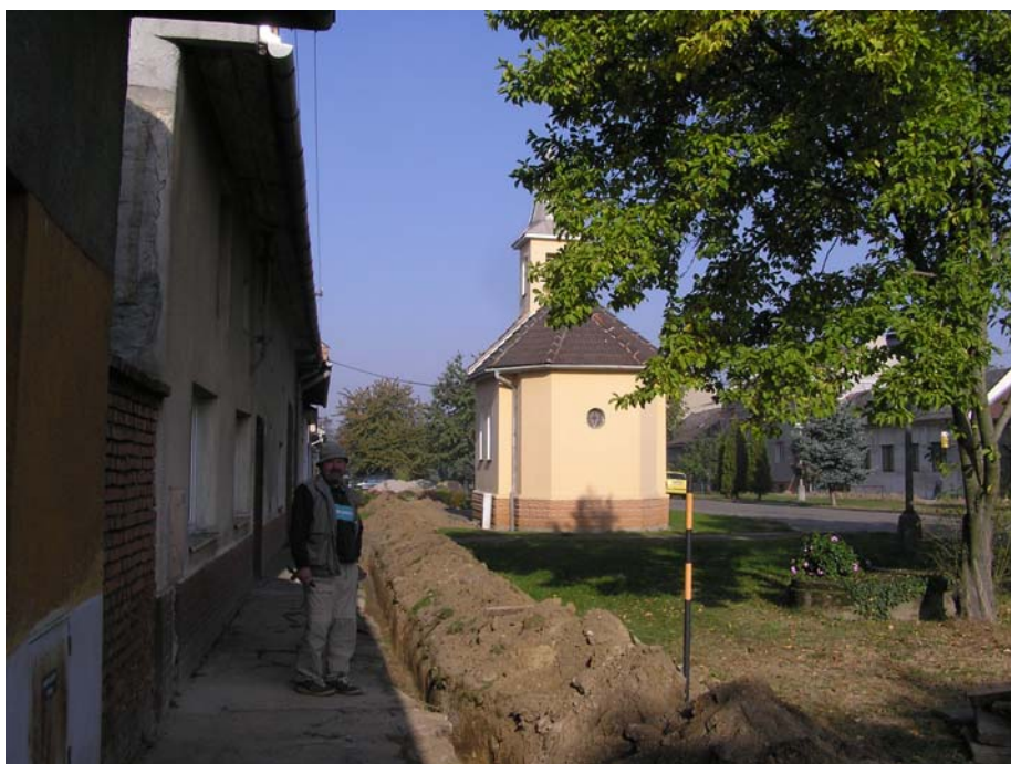
1.1 Přerov VIII – Henčlov, archeologický dohled nad výkopovými pracemi v ulici Zakladatel.